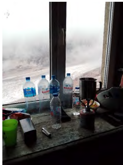
Малко за бита в хижа Бетлеми хът.