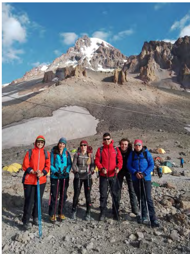
Снимка преди да тръгнем надолу.