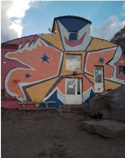
Хижа Бетлеми хът