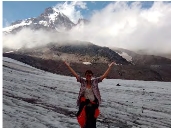
Зад мен е ледникът Гергети и Казбег